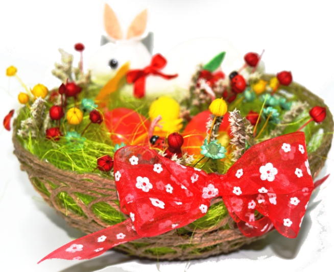
Cosulet de Paste (17x10 cm)