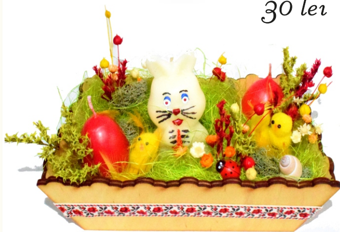
Aranjament de Paste Rustic 1 (14x20x10 cm)