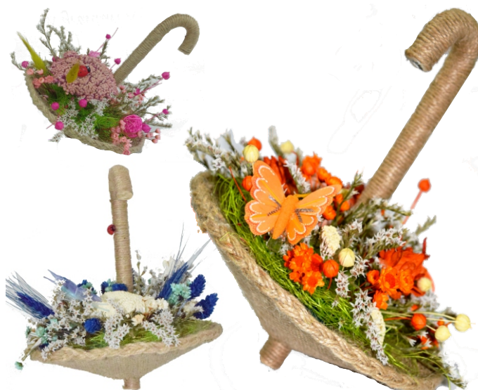
Aranjament „Umbreluta” (17x23 cm)