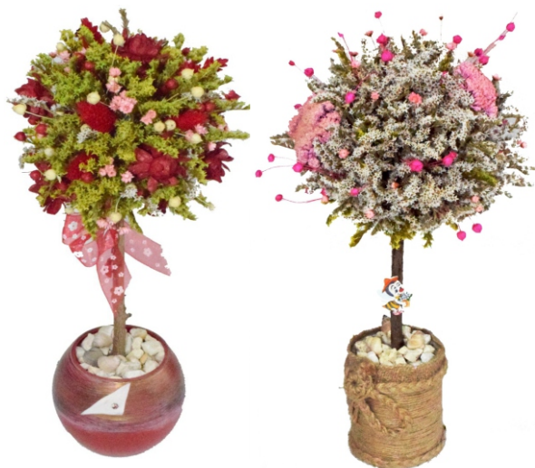
Aranjament „Copac cu flori” (14x44cm)