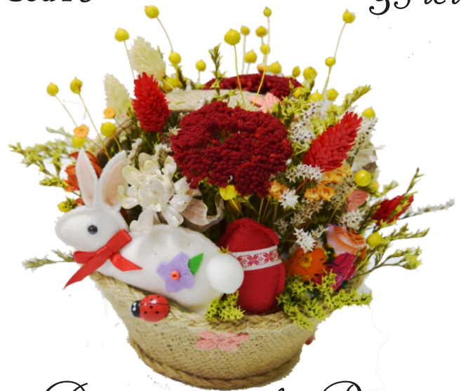
Aranjament de Paste „Cos pastelat” (16x20 cm)