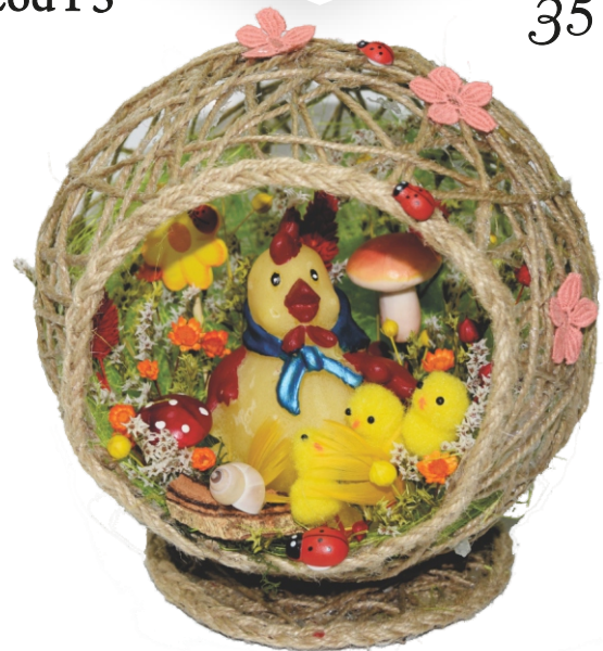
Aranjament „Cuib” (18x20 cm)