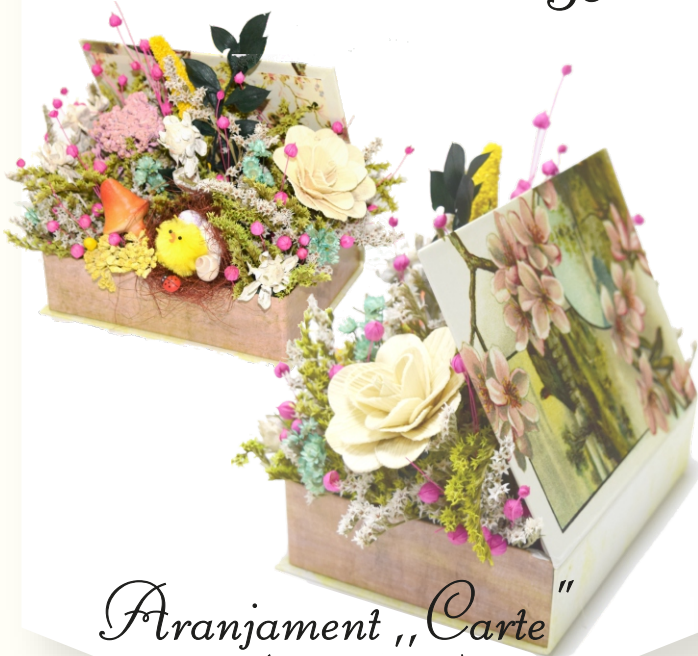
Aranjament „Carte” (14x20x17 cm)