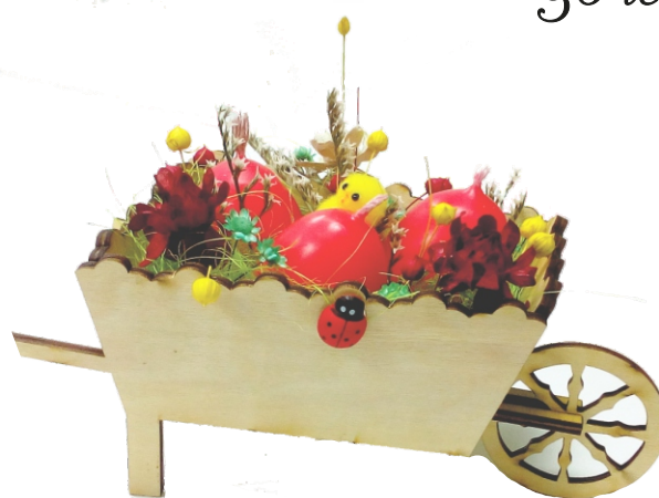
Aranjament de Paste Rustic 2 (14x20x10cm)

Detalii si comenzi la tel.: 0233-791554, 0753 011 608 email: comenzi@fundatiasperanta.ro